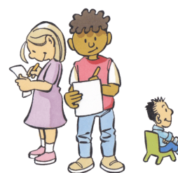
4. JIJ DOET HET ZELF