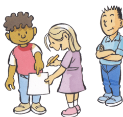
3. JULLIE DOEN HET SAMEN