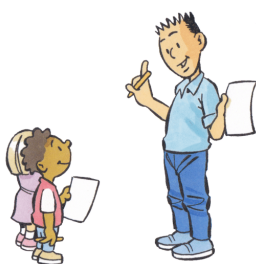
1. IK DOE HET VOOR