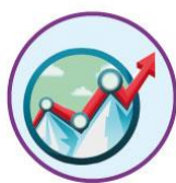
tabellen grafieken schema's