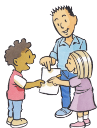
2. WIJ DOEN HET SAMEN